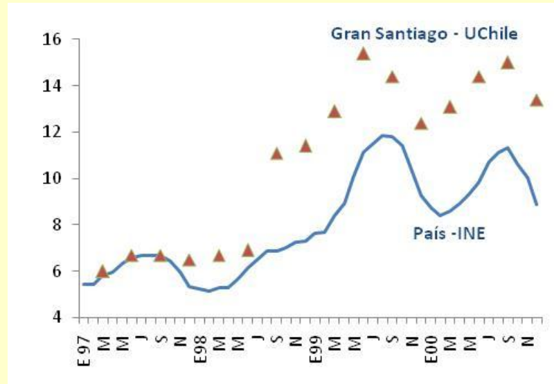
Gráfico N° 2 TASA DE DESOCUPACIÓN (%)